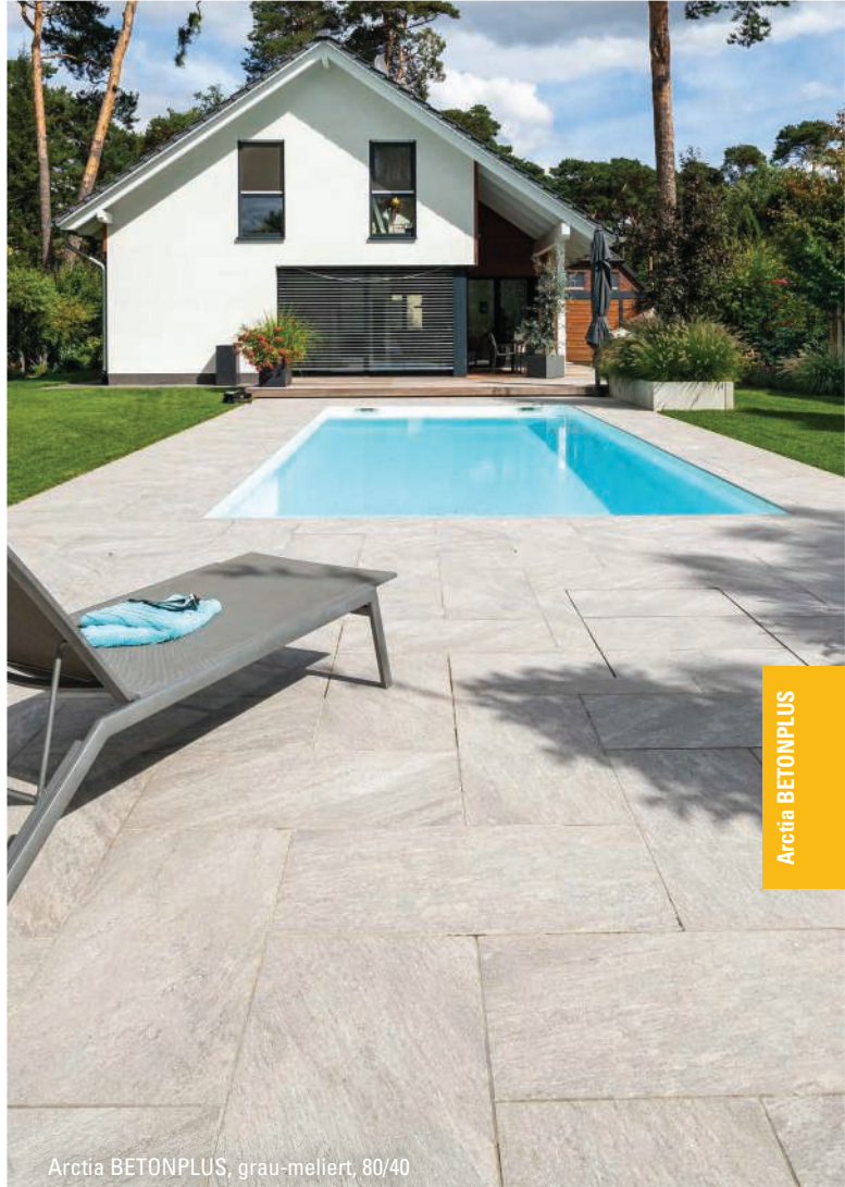
Arctia BETONPLUS, grau-meliert, 80/40