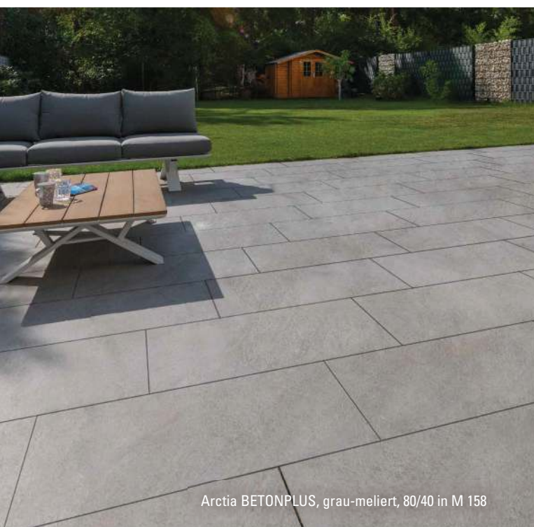
Arctia BETONPLUS, grau-meliert, 80/40 in M 158