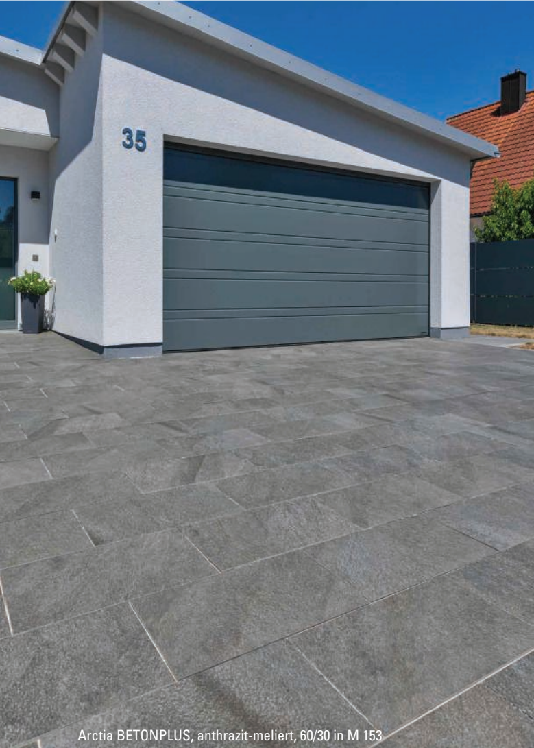
Arctia BETONPLUS, anthrazit-meliert, 60/30 in M 153