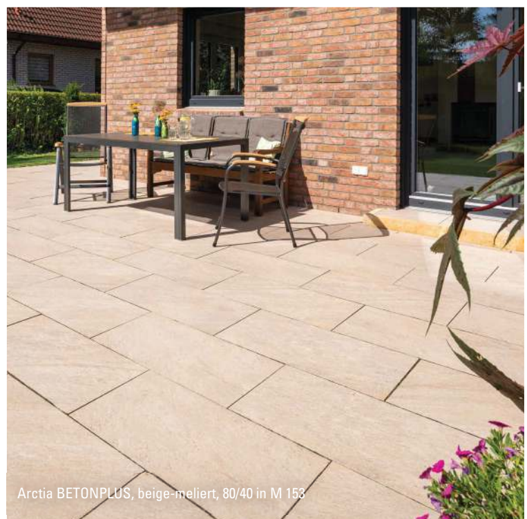
Arctia BETONPLUS, beige-meliert, 80/40 in M 158