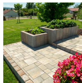
Palissades La Tierra®