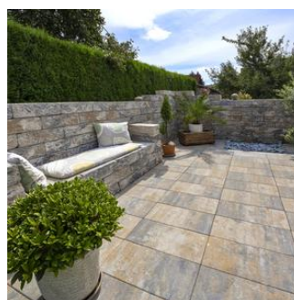
Dalles La Tierra®