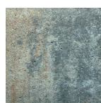
Calcaire coquillier nuancé