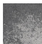
Gris/ anthracite nuancé

Gris/ anthracite nuancé uniquement disponible en Allemagne Sud et France