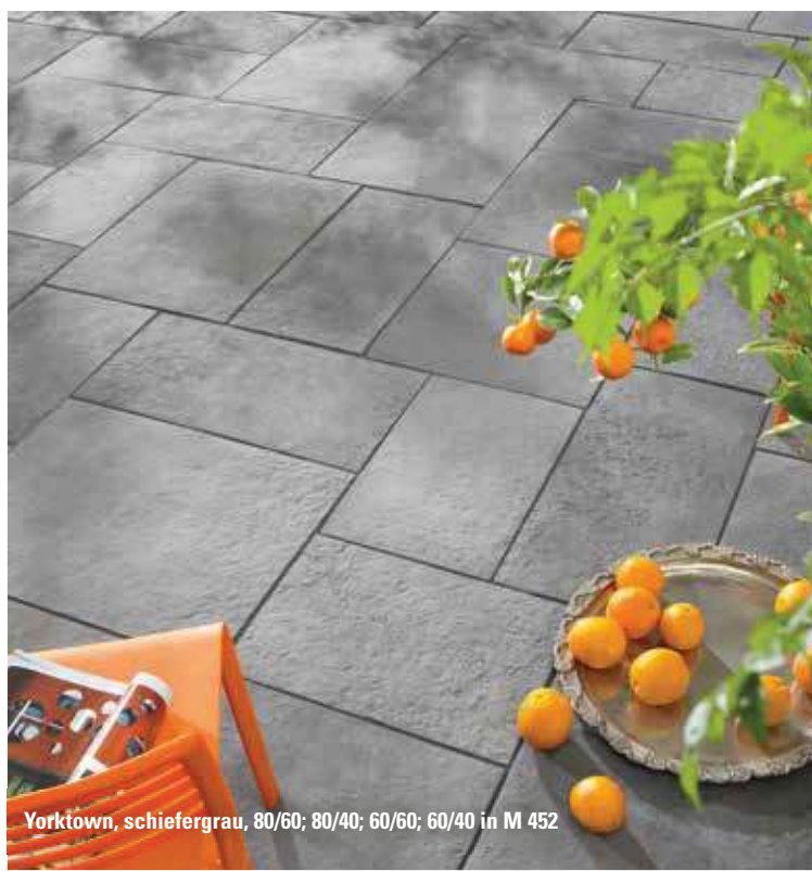
Yorktown, schiefergrau, 80/60; 80/40; 60/60; 60/40 in M 452