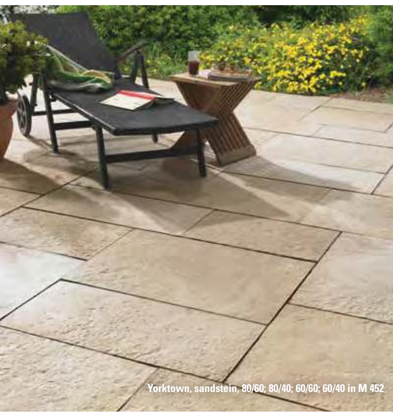
Yorktown, sandstein, 80/60; 80/40; 60/60; 60/40 in M 452

1) Optional als kombinierte Liefereinheit für wilden Verband nach Muster M 452, Paket 5,2 m 2 lieferbar Pro Paket: 4 St. 60 x 40 cm, 2 St. 60 x 60 cm, 5 St. 80 x 40 cm, 4 St. 80 x 60 cm