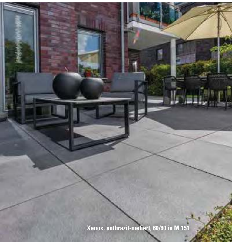
Xenox, anthrazit-meliert, 60/60 in M 151

Die Größe von Granitkeramik-Platten kann aufgrund der Plattendicke nicht – wie häufig bei Fliesen üblich – durch Anritzen und Brechen angepasst werden. Sie benötigen stattdessen einen Winkelschleifer oder einen Nassschneider mit einer für Feinsteinzeug geeigneten Trennscheibe. Feine Kantenausbrüche nach dem Schneiden können mit Trockenschleifpads ausgeschliffen bzw. kaschiert werden.