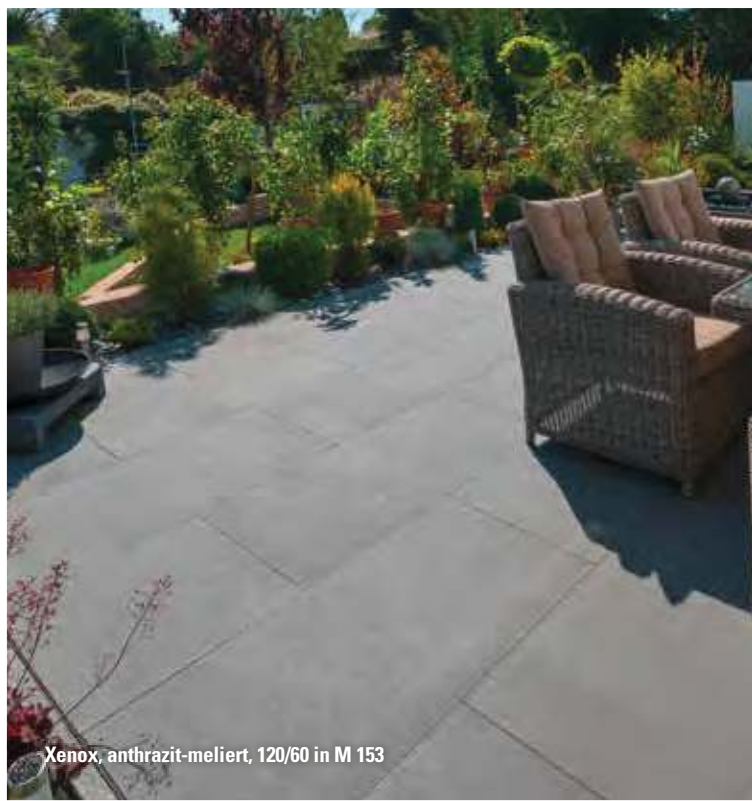
Xenox, anthrazit-meliert, 120/60 in M 153