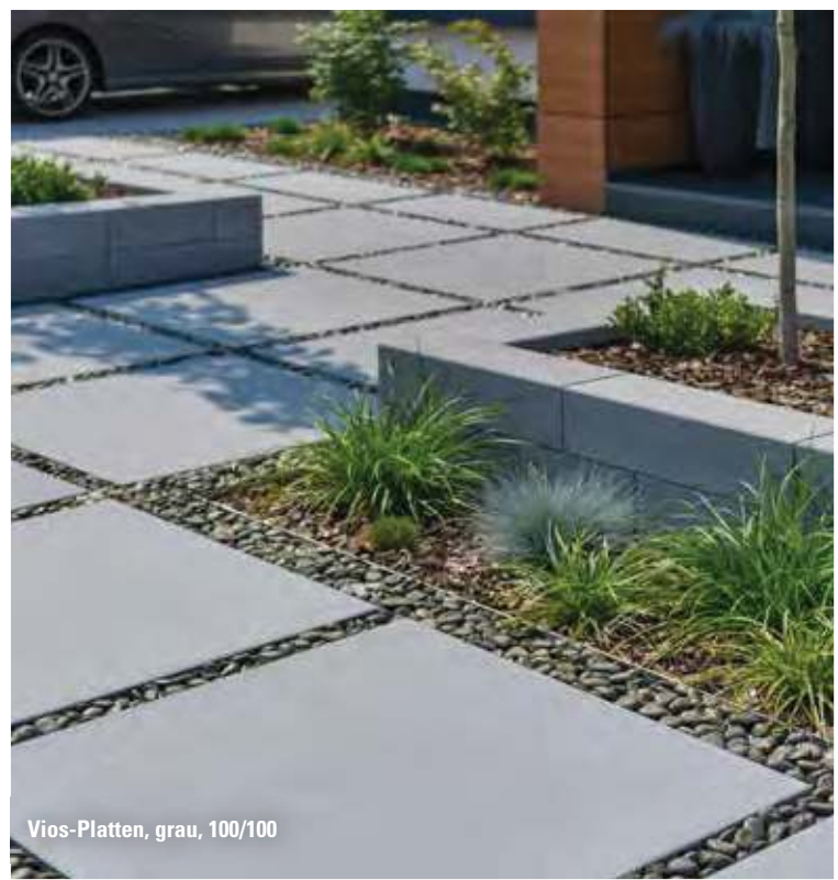
Vios-Platten, grau, 100/100