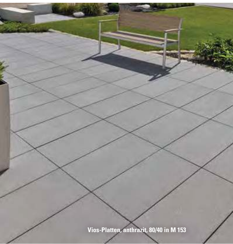
Vios-Platten, anthrazit, 80/40 in M 153