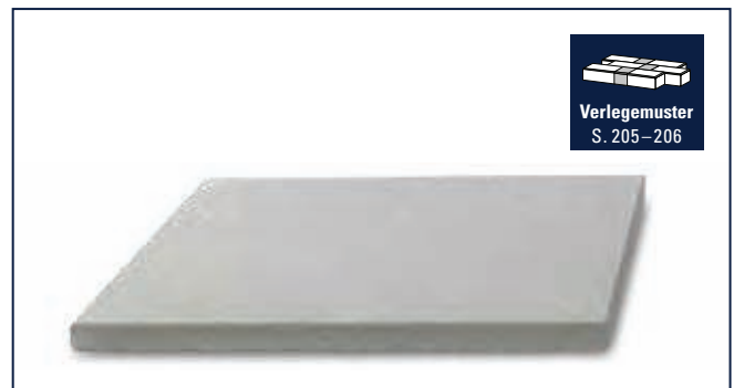
Verlegemuster S. 205–206