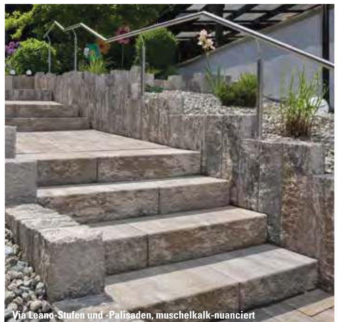
Via Leano-Stufen und -Palisaden, muschelkalk-nuanciert