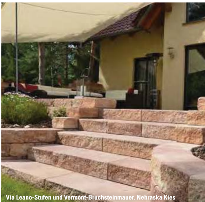
Via Leano-Stufen und Vermont-Bruchsteinmauer, Nebraska Kies