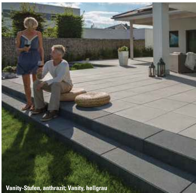
Vanity-Stufen, anthrazit; Vanity, hellgrau