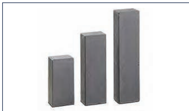
Stufen S. 232-233