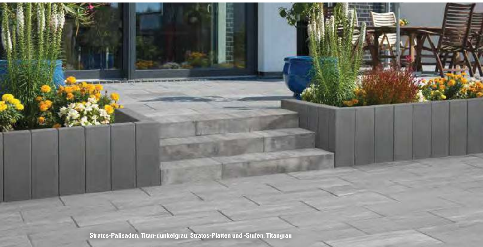
Stratos-Palisaden, Titan-dunkelgrau; Stratos-Platten und -Stufen, Titangrau