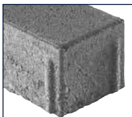
betonglatt, Minifase R5/2 mm*