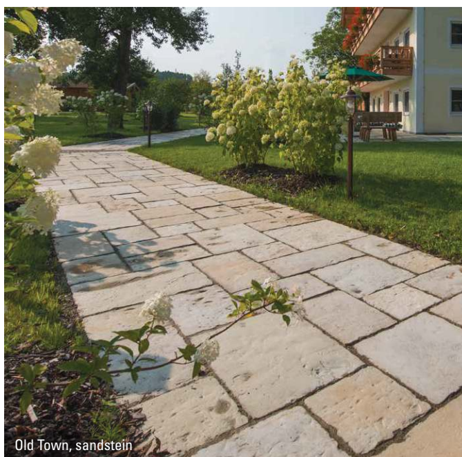
Old Town, sandstein