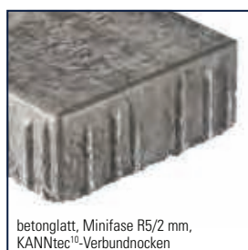
betonglatt, Minifase R5/2 mm, KANNtec 10 -Verbundnocken