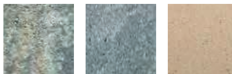
muschelkalk-nuanciert Nero Bianco Creme a)

a) Nur in der Region Nord/Ost erhältlich.