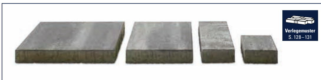
Verlegemuster S. 128–131