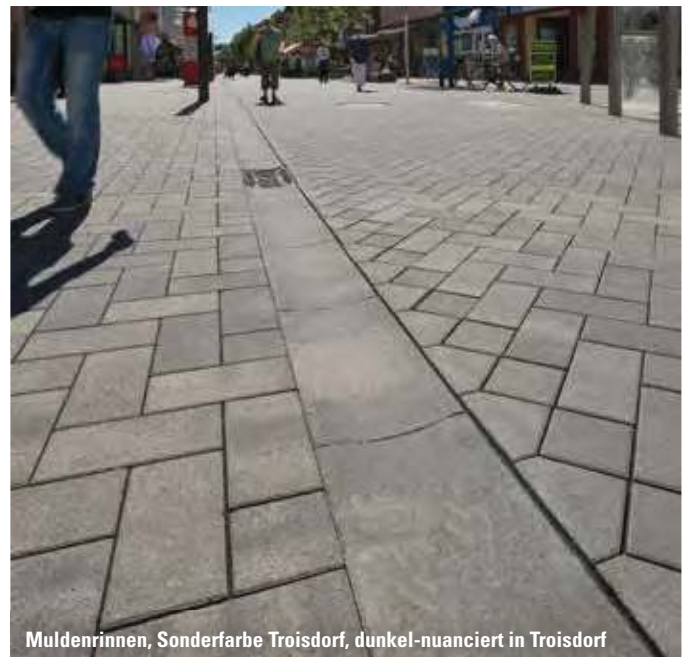
Muldenrinnen, Sonderfarbe Troisdorf, dunkel-nuanciert in Troisdorf