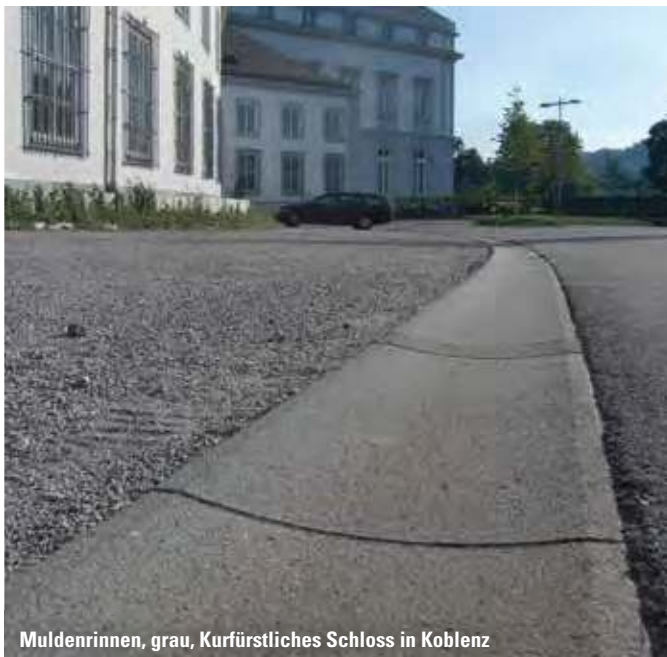
Muldenrinnen, grau, Kurfürstliches Schloss in Koblenz