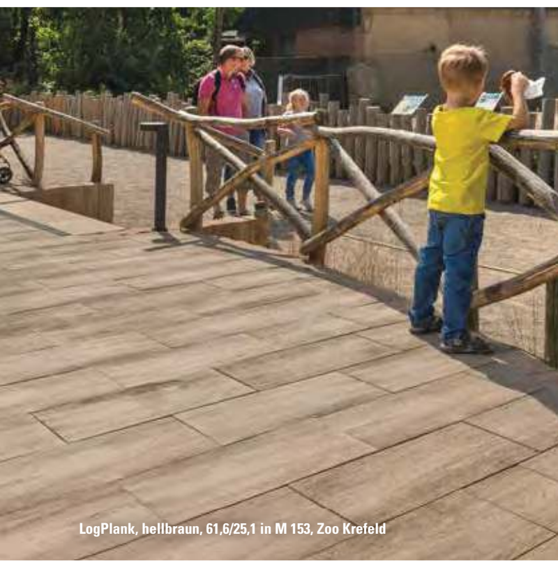
LogPlank, hellbraun, 61,6/25,1 in M 153, Zoo Krefeld