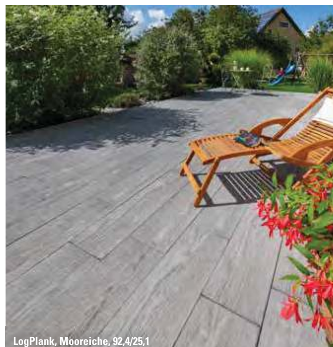
LogPlank, Mooreiche, 92,4/25,1