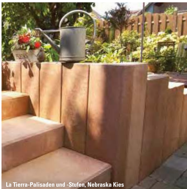
La Tierra-Palisaden und -Stufen, Nebraska Kies