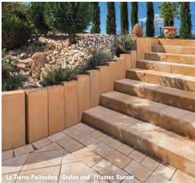
La Tierra-Palisaden, -Stufen und -Pflaster, Sunset