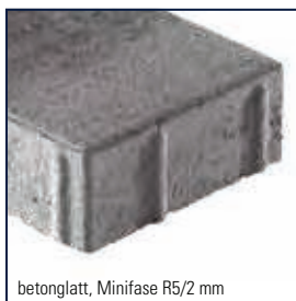
betonglatt, Minifase R5/2 mm