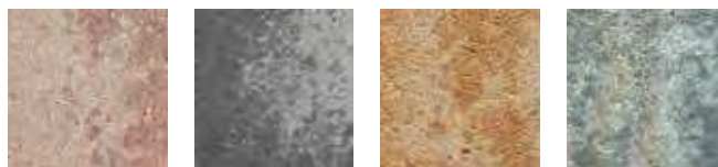
Nebraska Kies a) grau/anthrazit-nuanciert Sunset a) muschelkalk-nuanciert

a) Nur als kombinierte Lage für wilden Verband.