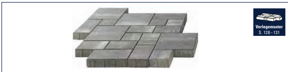
Verlegemuster S. 128-131