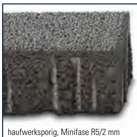
haufwerksporig, Minifase R5/2 mm