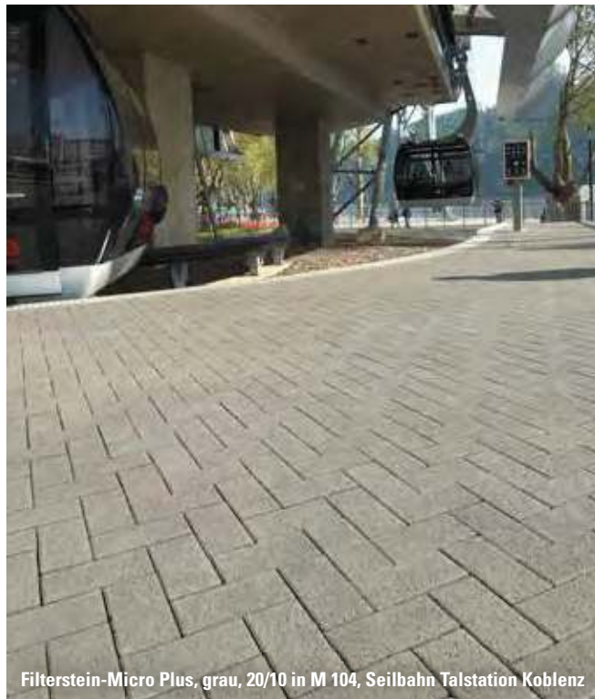
Filterstein-Micro Plus, grau, 20/10 in M 104, Seilbahn Talstation Koblenz

Weitere Farben, Dicken und Formate auf Anfrage. Nur in der Lieferregion West erhältlich.