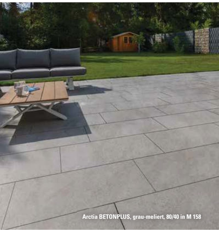
Arctia BETONPLUS, grau-meliert, 80/40 in M 158