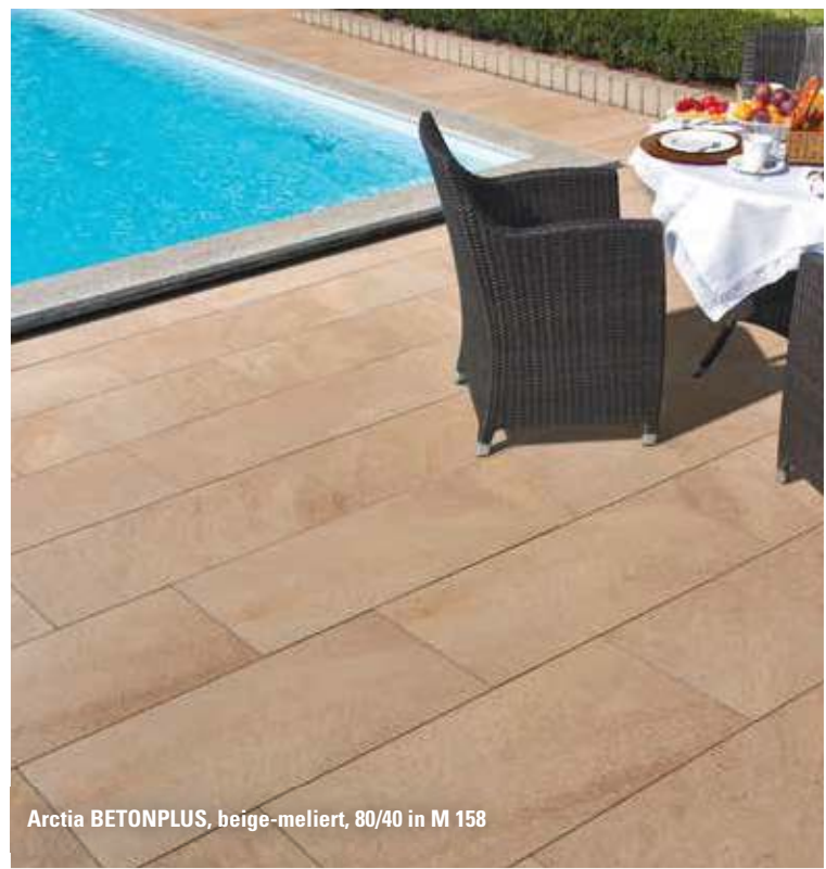
Arctia BETONPLUS, beige-meliert, 80/40 in M 158