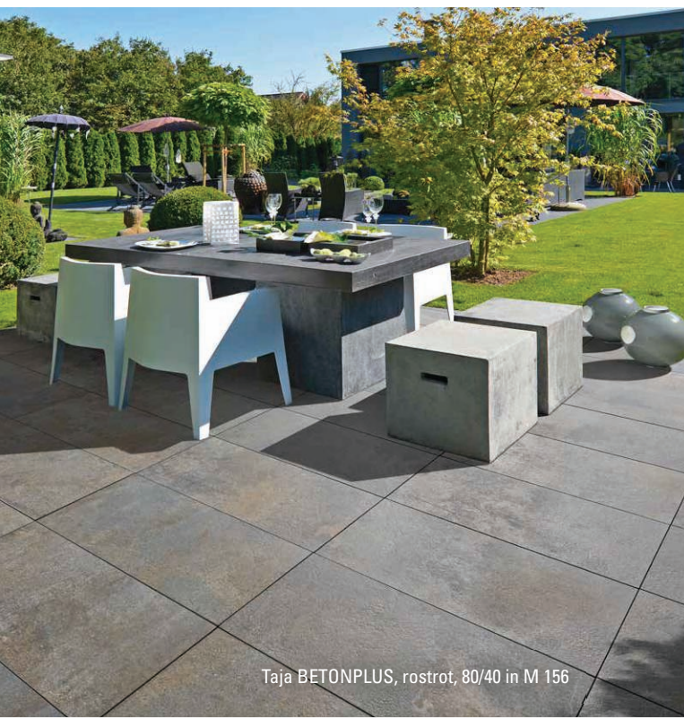
Taja BETONPLUS, rostrot, 80/40 in M 156